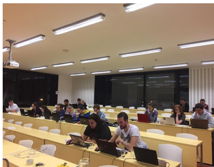
Obrázek 2 - Mapathon 15. 2. 2017