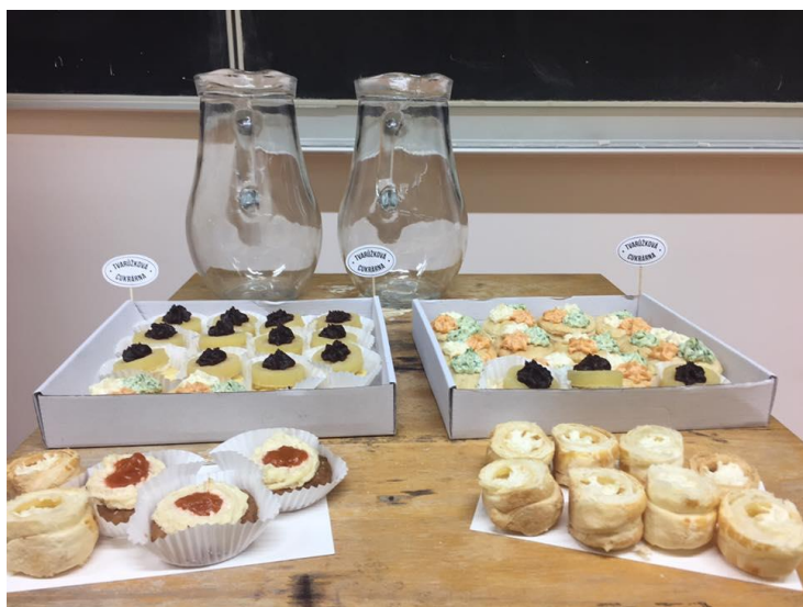
Obrázek 3 - Tradiční občerstvení - Tvarůžková cukrárna