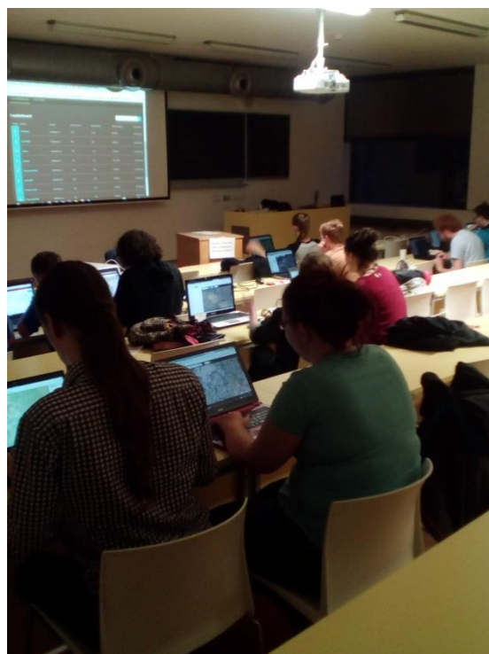
Obrázek 4 - Mapathon 5. 4. 2017