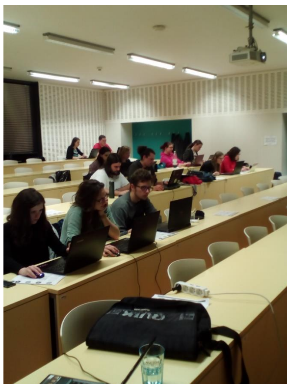
Obrázek 5 - Mapathon 26. 3. 2017