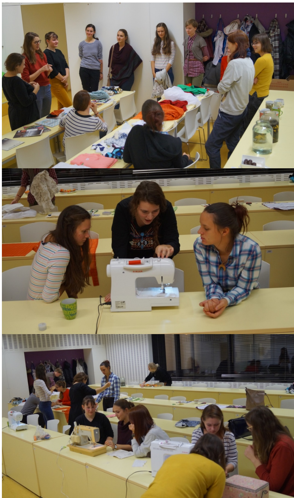
Příloha č. 3: Odkazy na událost Šicí dílna: Udržitelnost na míru na Facebookových stránkách spolku Udržitelný Palacký