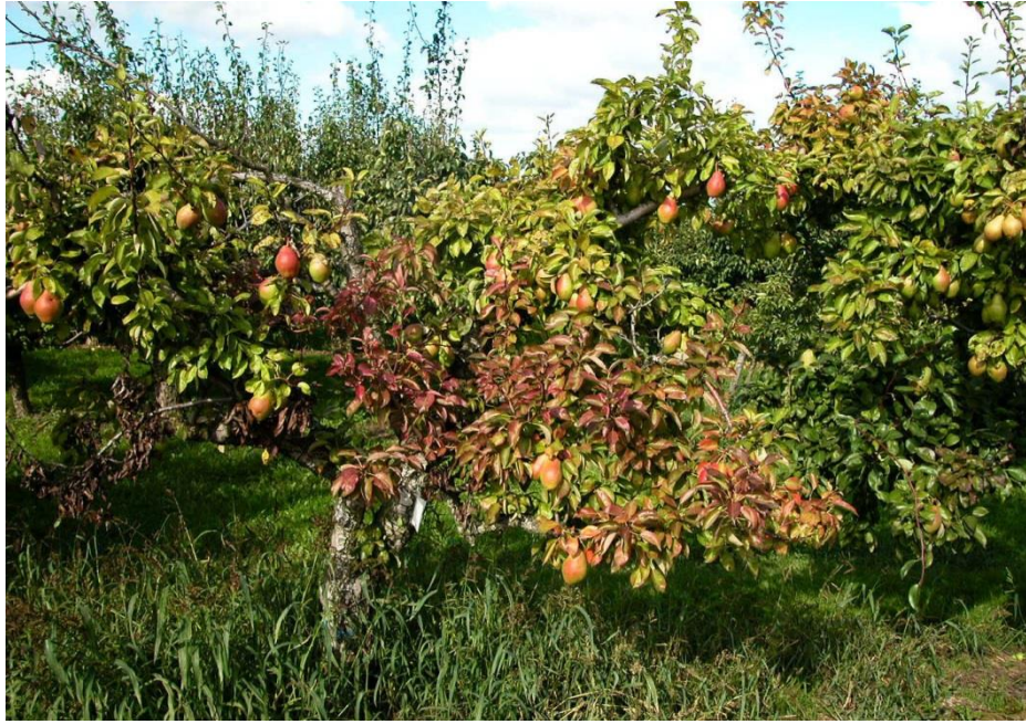
Obrázek 5: Předčasné červenání a chloróza hrušně vyvolaná fytoplazmou chřadnutí hrušně